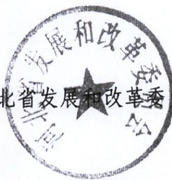
河北省发展和改革委员会