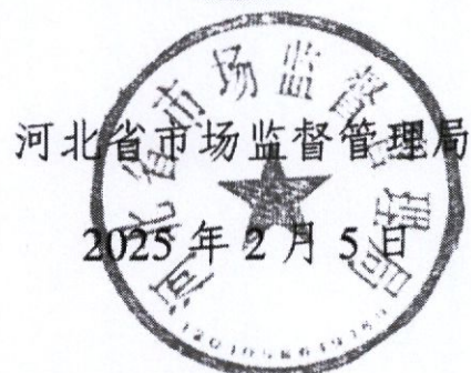
河北省市场监督管理局