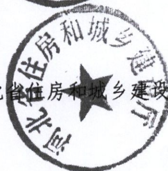
河北省住房和城乡建设厅